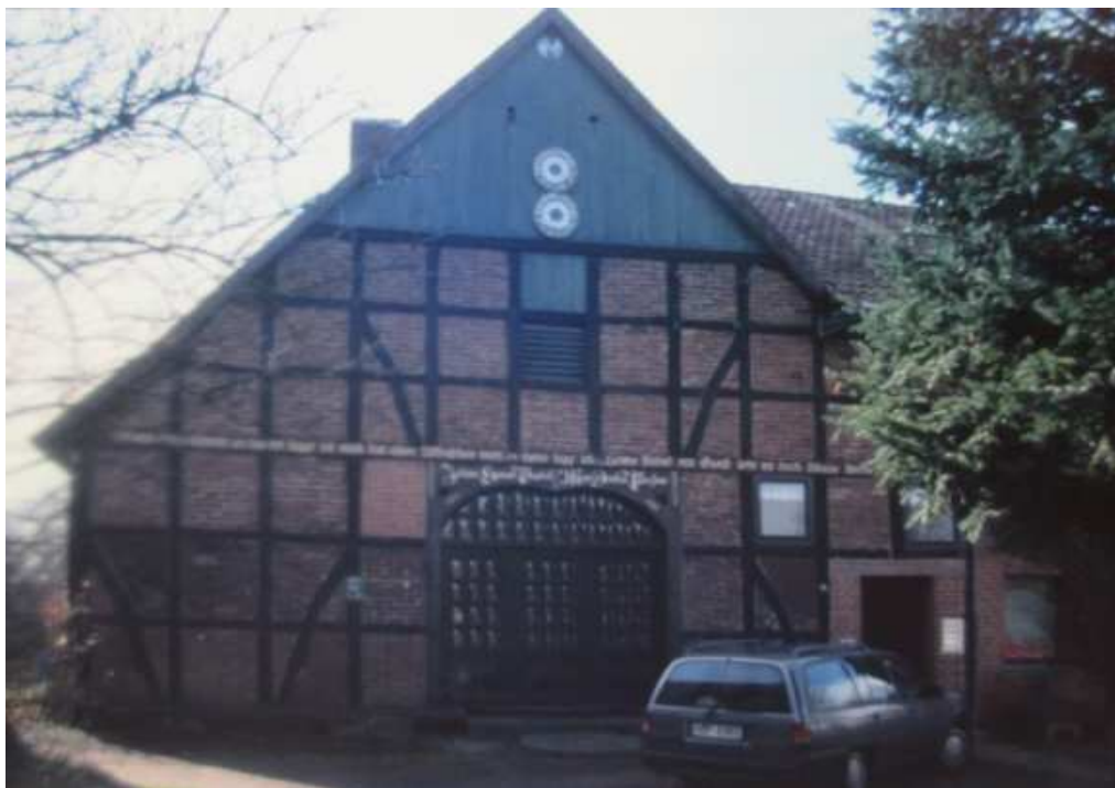
Hof Nr. 15 im Jahre 1997

1993 bauten zwei Störche ein neues Nest auf einem Schornstein der Firma Finke Holzbau.