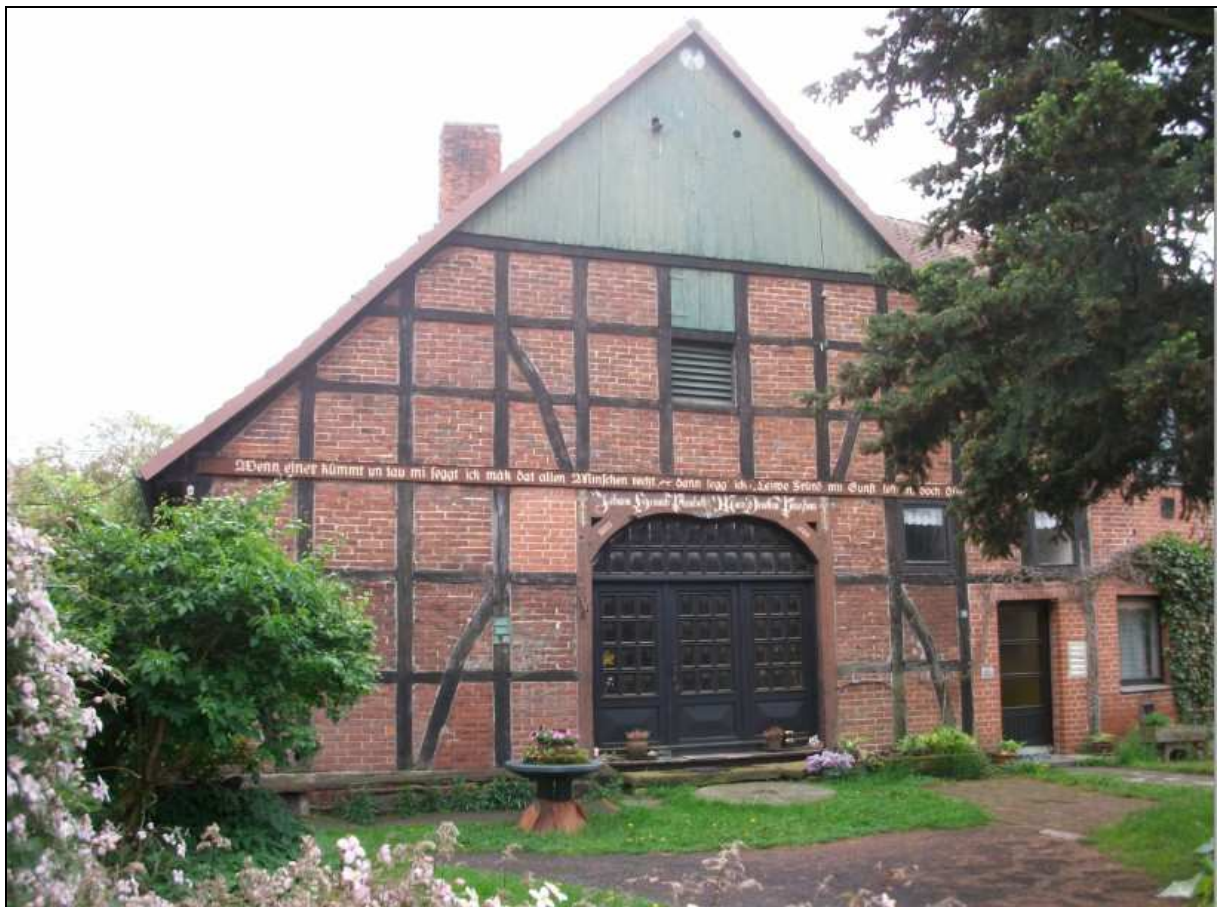
Der Hof Nr. 15 im Jahre 2013

Seit 1998 ist das Storchennest mit Ausnahme von jeweiligen „Kurzbesuchen“ leider unbesetzt geblieben. 1999 sind Störche zunächst in Frielingen gewesen, dann aber nach Bordenau umgezogen. Die Orientierung zur Leine hin überrascht eigentlich nicht, denn der Lebensraum dort ist attraktiver.