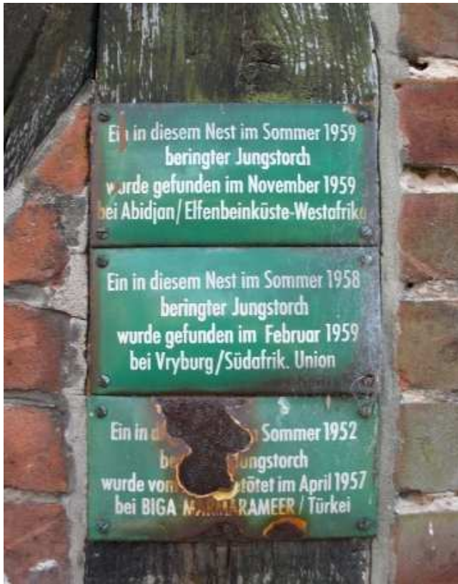
Tafeln am Hofgebäude Nr. 15

haben 22 Storchenaare das Nest bewohnt, davon 16 mit Bruterfolg. 53 Jungstörche sind im diesem Zeitraum ausgeflogen. Von 1972 bis 1992 waren keine Störche in Frielingen.