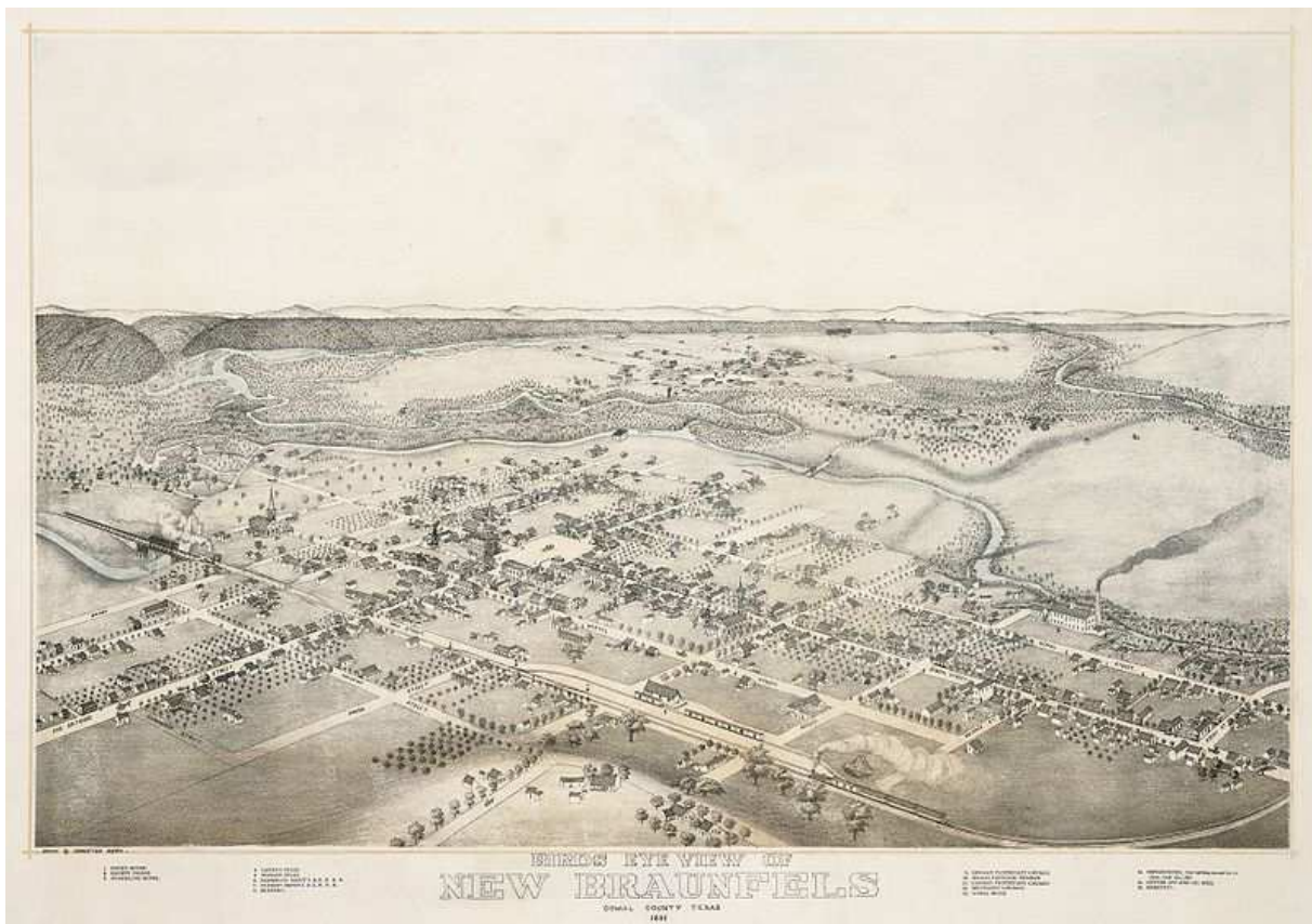
New Braunfels 1881

Texas war ein Schwerpunkt deutscher Auswanderer. So wurden 1845 und 1846 New Braunfels und Fredericksburg als Projekte deutscher Adeliger gegründet 1 . Texas wurde 1836 unabhängig (von Mexico) und schloß sich 1845 den USA an. Im Sezessionskrieg 1861 – 1865 trat Texas aus den USA wieder aus. Nach dem Krieg musste Texas mit dem Civil Rights Act leben, der die Sklaverei abschaffte 2 .